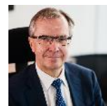
Pentti Hakkarainen Member of the Supervisory Board, European Central Bank